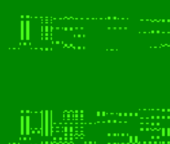
图 1 卡尔费休水分测定仪测试数据图